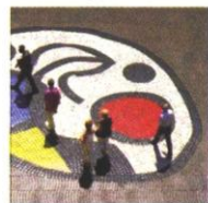
Paviment del Pla de l'Òs

(1) Barcelona: Fundació Miró , la col·lecció pública més completa de l'obra de Joan Miró, creada el 1971 per Miró amb l'arquitecte Josep Lluís Sert; el mural de ceràmica de la Terminal B de l'aeroport, en col·laboració amb Llorenç Artigas (1970); el paviment ceràmic del Pla de l'Òs (1976), a la Rambla, i l'escultura Dona i ocell del Parc de l'Escorxador, amb Joan Gardy Artigas. (4) Centre Miró de Mont-roig del Camp .