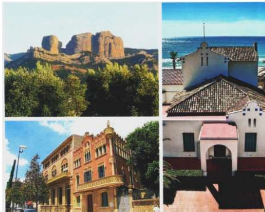
A dalt a l'esquerra, la muntanya de Sant Bàrbara, a Horta de Sant Joan; a sota, les cases modernistes Rull i Gassó, a Reus; a la dreta, la Vil·la Pau Casals, al Vendrell. / A.1. HORTA DE SANT JOAN / TURISME DE REUS / LINUS URPI