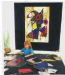
El Centre Miró de Mont-roig.

Mont-roig del Camp forma part del projecte El Paisatge dels Genis, una iniciativa turística que vincula quatre municipis de les comarques de Tarragona amb els creadors universals que hi van deixar la seva petjada. A més de Mont-roig amb Joan Miró, hi participen el Vendrell amb Pau Casals, Reus amb Antoni Gaudí i Horta de Sant Joan amb Pablo Picasso. Es tracta d'una ruta que aporta les claus per entendre mi-