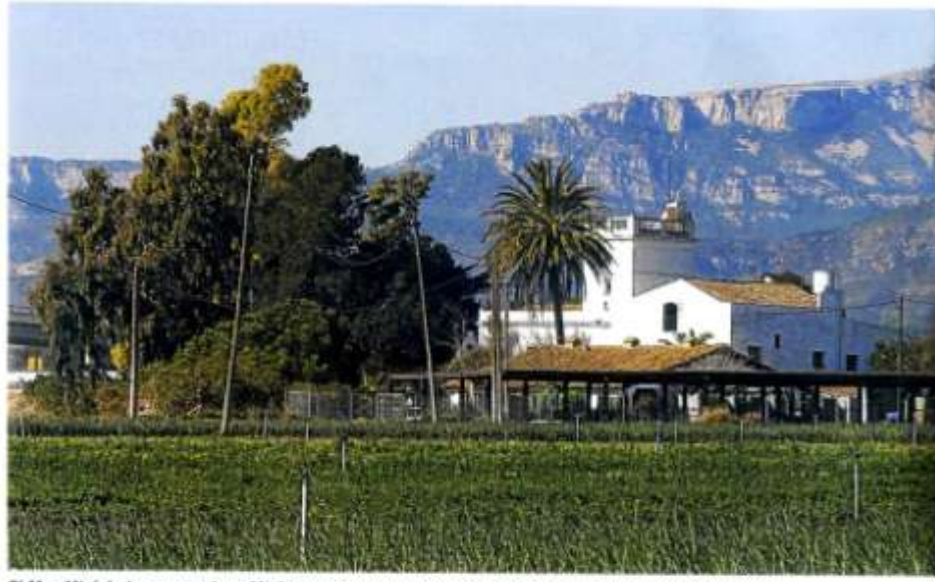
El Mas Miró és la casa on Joan Miró va passar temporades durant 65 anys.