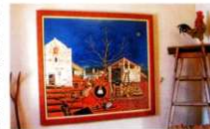
Còpia del quadre 'La masia', al Centre Miró.

apareix al quadre Platja de Mont-roig (1916). L'ermita de la Mare de Déu de la Roca és el punt més elevat de l'itinerari, on es pot observar el to rogenc de la pedra que dona nom al municipi i que tant va impactar Miró, fins al punt de reflectir-la al quadre Mont-roig. Sant Ramon (1916). La passejada passa per l'interior del centre urbà i també per la zona de masies a l'entorn del Mas Miró, a mig camí entre el poble i la platja.